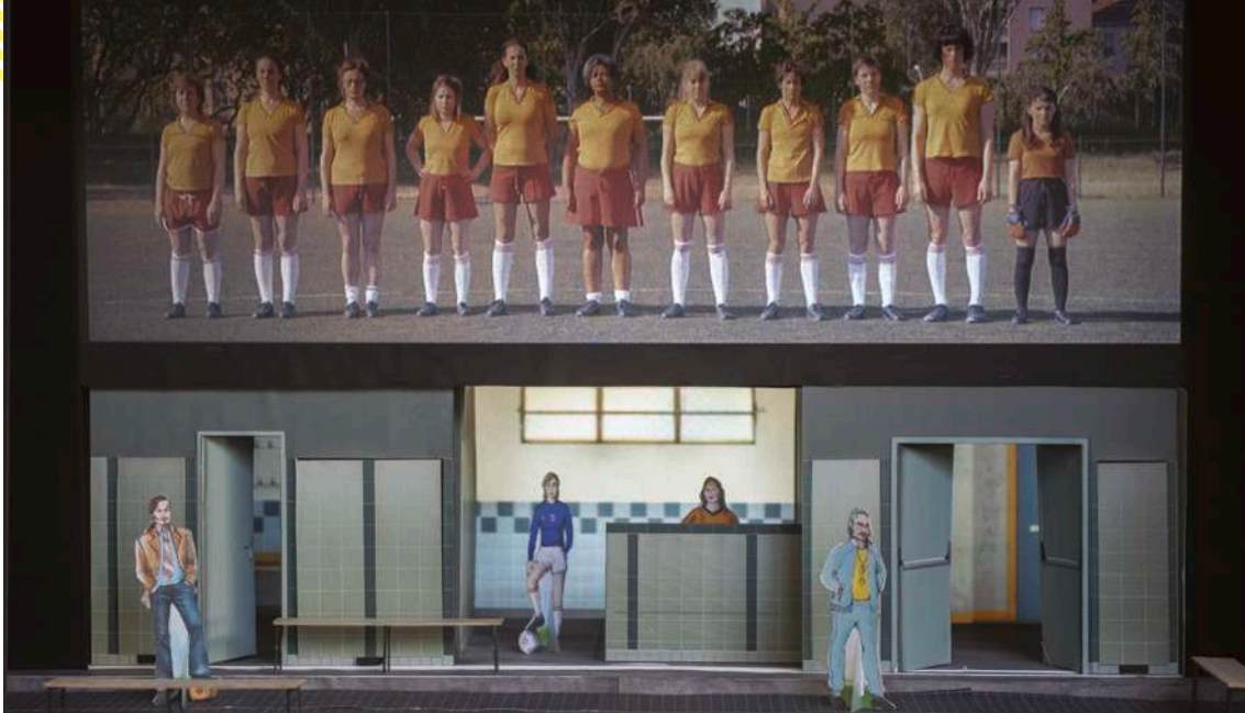
Photo de la maquette du décor, septembre 2019.