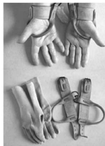
Extrait de Fanny Gallot, En découdre , La Découverte, 2015.